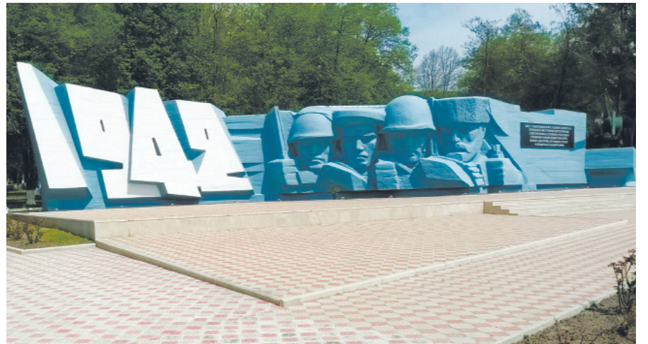
Обновленный Монумент защитникам Эльхотовских ворот

В битвах и сражениях Великой Отечественной войны уроженцы Северной Осетии и в частности Кировского района занимают особое место. Они воевали на всех фронтах, участвовали в обороне Ленинграда и Москвы, Сталинградской, Курской и других важнейших операциях, а также сражались насмерть в боях против японских милитаристов.